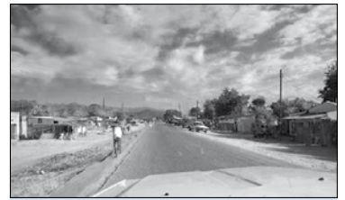
Volgende halte Mangochi