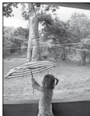
Hagel in de tropen