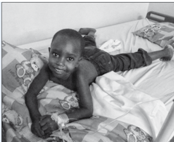
Eén van de kinderen na de grootste schrik