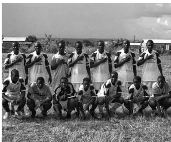
Het Mushili voetbalteam

De jongeren hebben ook de mogelijkheid om via ons een Bijbelcursus te volgen. Ze krijgen een boekwerk wat ze moeten lezen waarna ze vragen moeten beant-