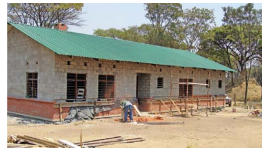
Zo is het geworden!

sproken dag, maar dat kan best 3 dagen later worden. De chauffeur van de vrachtwagen met de goederen komt langs een dorpje waar een bekende woont en die gaat hij eerst bezoeken. Verderop is er een politiecontrole om het salaris van de ambtenaren in functie wat aan te vullen ... En als de lading er dan eindelijk is, moeten er vrijwilligers opgetrommeld worden om te lossen. Deze mensen hebben ieder persoonlijk instructies nodig over hoe de zakken op te stapelen, anders gaat de boel glijden en kan men opnieuw beginnen.