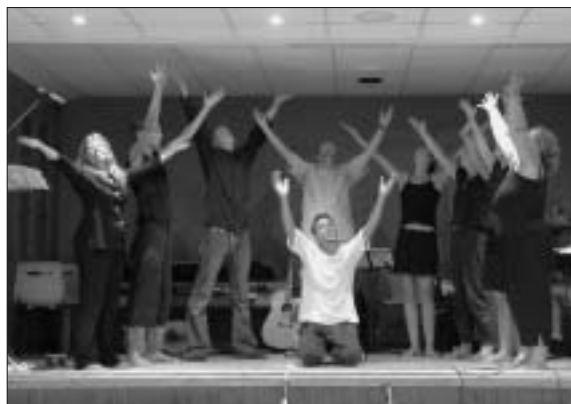
Deelnemers aan het Missioncamp tijdens het mime-spel.

De volgende dag hebben we folders verspreid. Eén folder was een uitnodiging voor de evangelisatieavond en de andere ging over de Bijbel. De brievenbussen in de Franse dorpjes zitten verstopt tussen hagen en achter hekken. Het was een hele klus. Som-